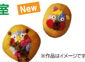
※作品はイメージです