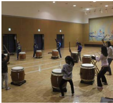
▲基本的な打ち方からゆっくり指導します

和太鼓の創作曲を楽しみながら、柔軟性や足腰の強さ、リズムカルな音楽性を伸ばしましょう。