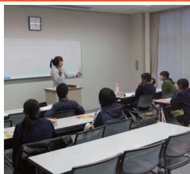
▲自主的に考え、学ぶ意欲を育みます