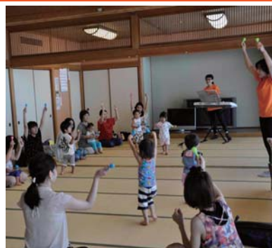
▲保護者の方も一緒に楽しめる内容です

お母さんと「親子のつながり」「心の絆」を深めながら、子どもの発達段階に合わせ、音楽を素材とし、運動、感覚、社会性などを育み、社会の一員となる子どもの「育ち」をサポートします。